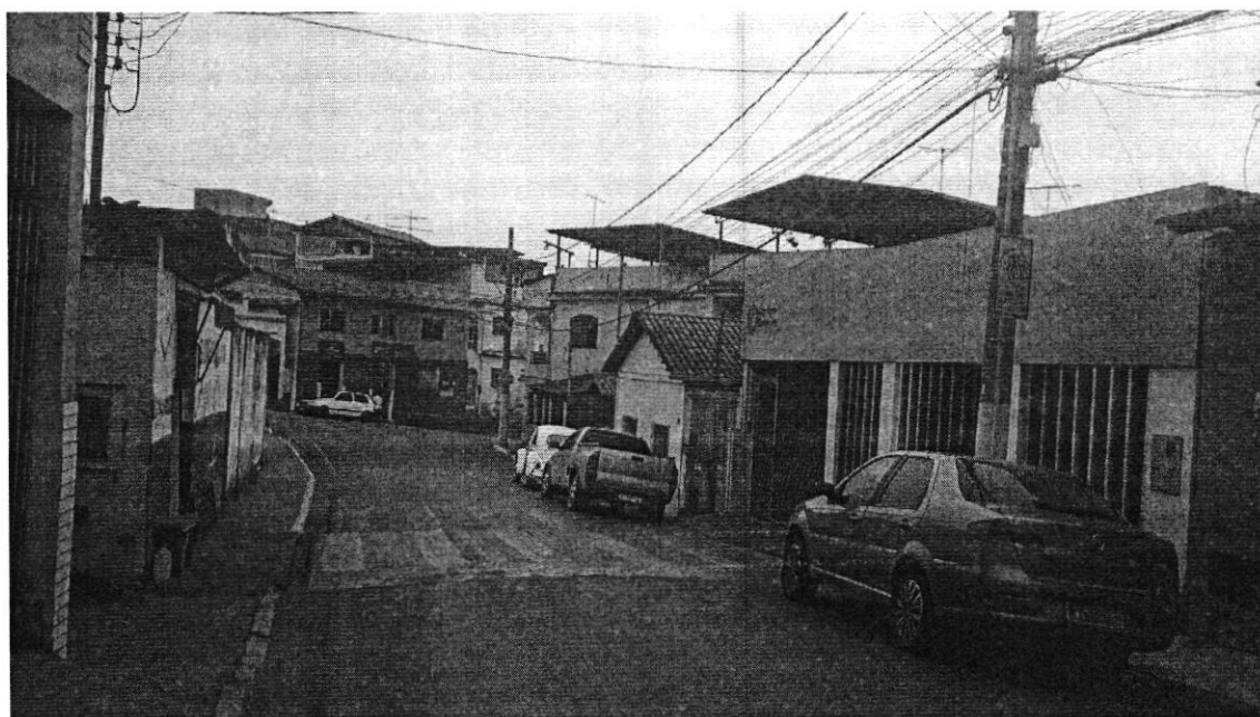
Faixa Elevada de Pedestre em Frente ao Colégio Sagrado