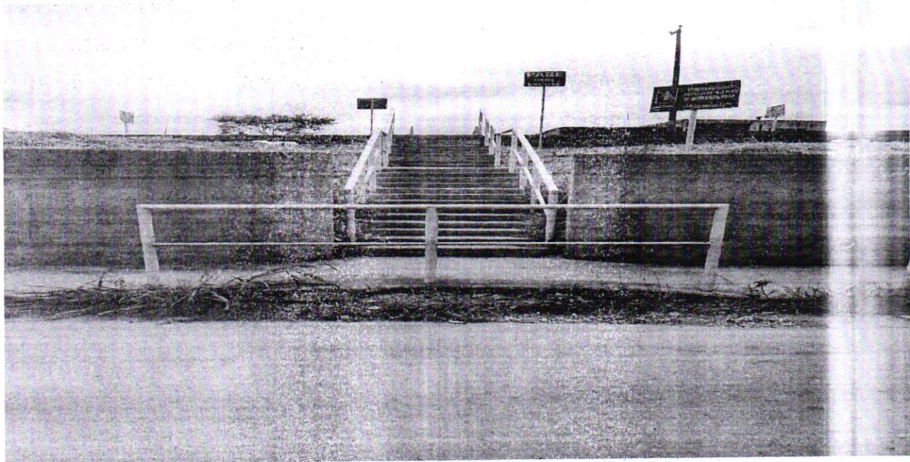
(Rua Maria de Melo Alvim, Bairro Boa Vista)

Sendo assim, conto com a sua compreensão no atendimento deste e deixo aqui meu agradecimento.