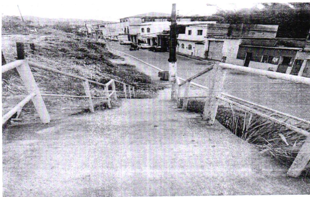
(Rua Doutor Vitorino, Vila São Vicente)

O vereador que o presente subscreve, em conformidade com as normas regimentais vigentes, ouvido o plenário, vem requerer ao excelentíssimo senhor Cláudio Antônio de Souza, Prefeito Municipal de Congonhas, que avalie a possibilidade de instalação de iluminação, sinalizações adequadas e câmeras do programa olho vivo na passagem que liga os bairros Bom Jesus (próximo as ruas Ceará e Sergipe), Boa vista ( Avenida Maria de Melo Alvim) a Rua Doutor Vitorino, Bairro Vila São Vicente.