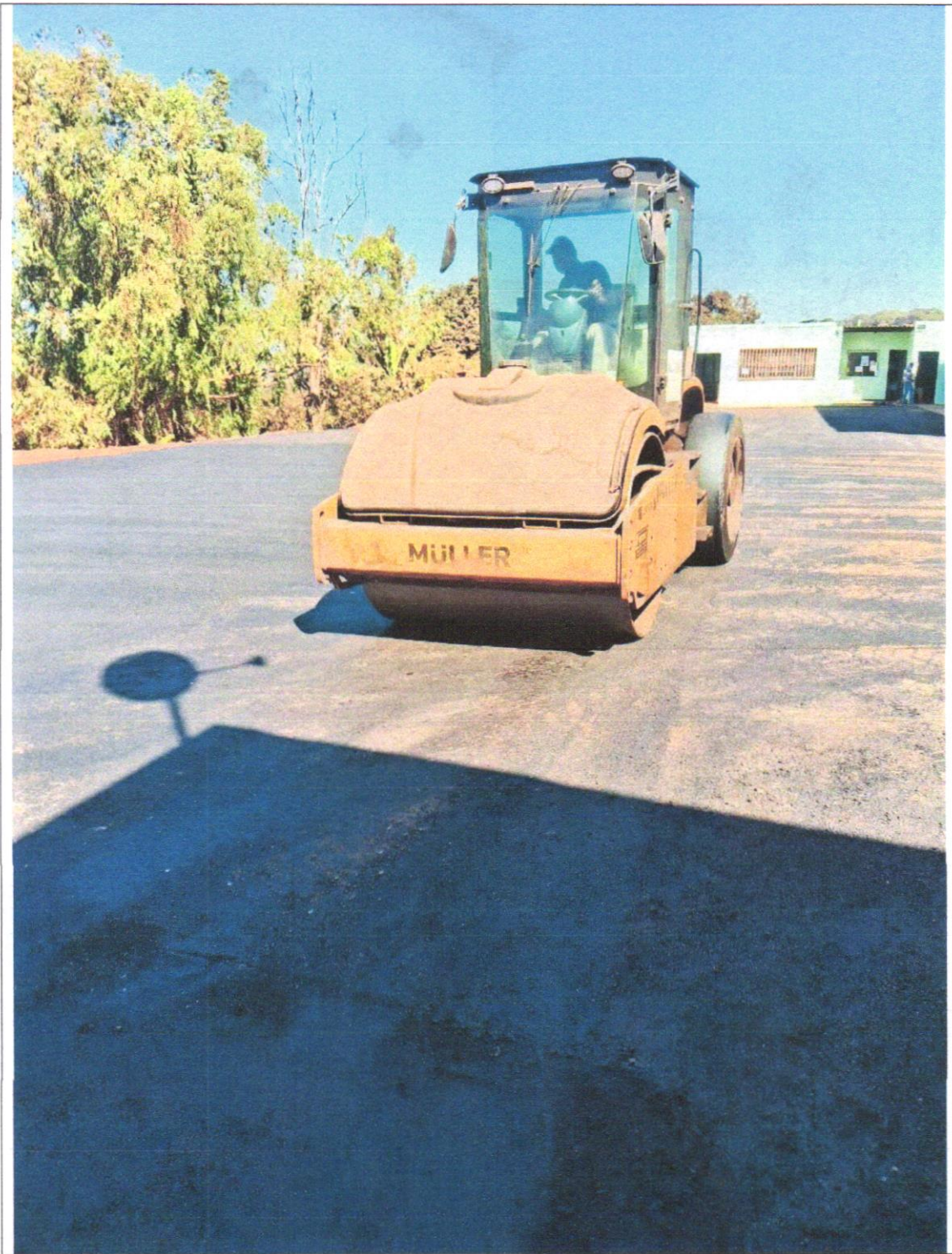
DESCRIÇÃO: Pavimentação asfáltica