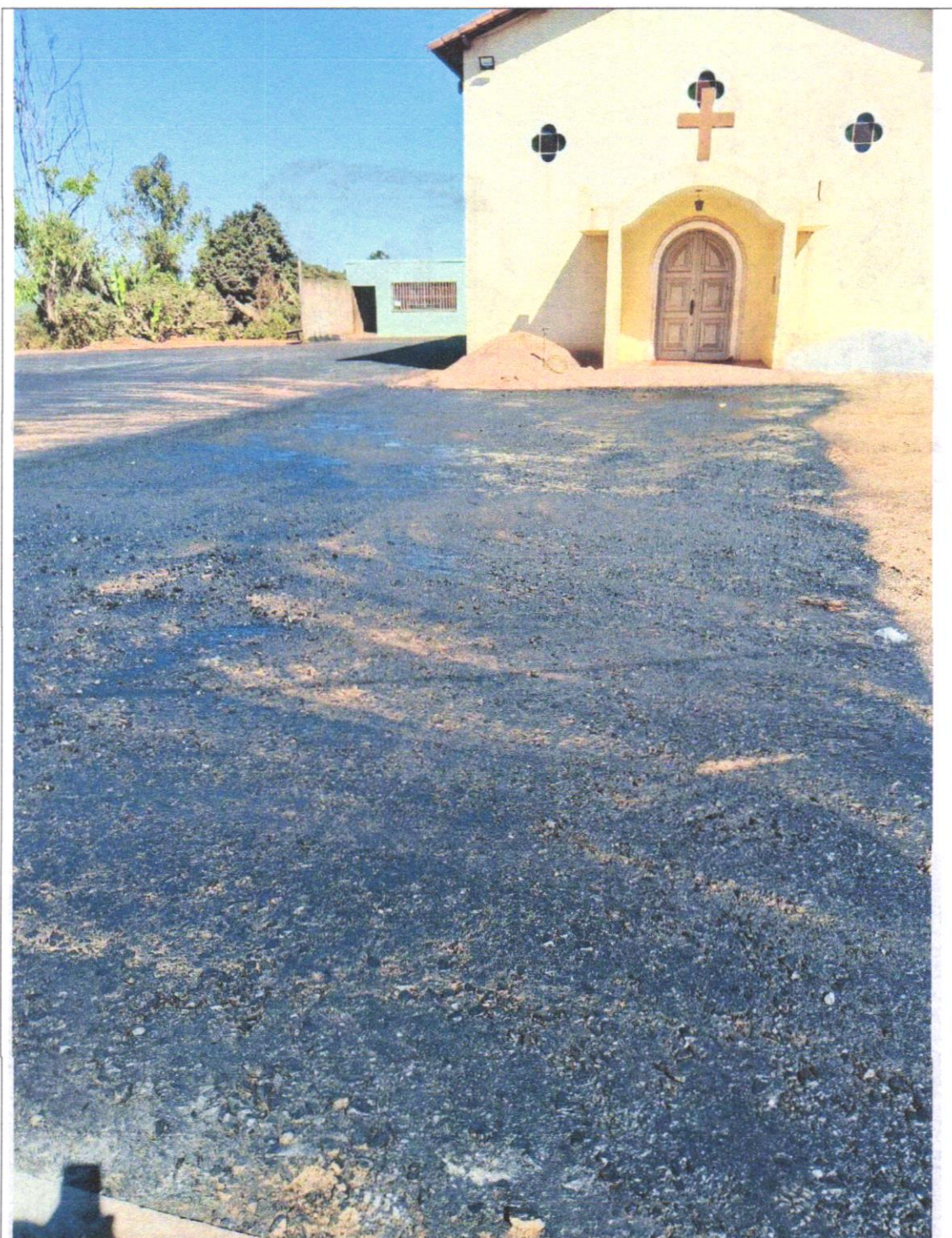
DESCRIÇÃO: Pavimentação asfáltica