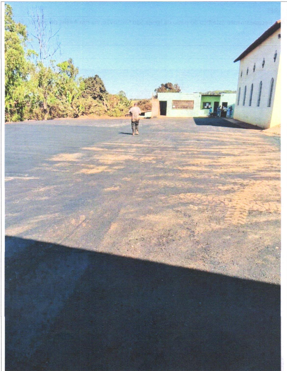
DESCRIÇÃO: Pavimentação asfáltica