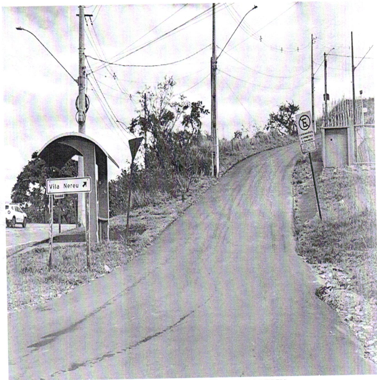
Rua Conceição Gomes Nereu, VILA NEREU

Casa do Legislativo Vereador Ênio da Gama