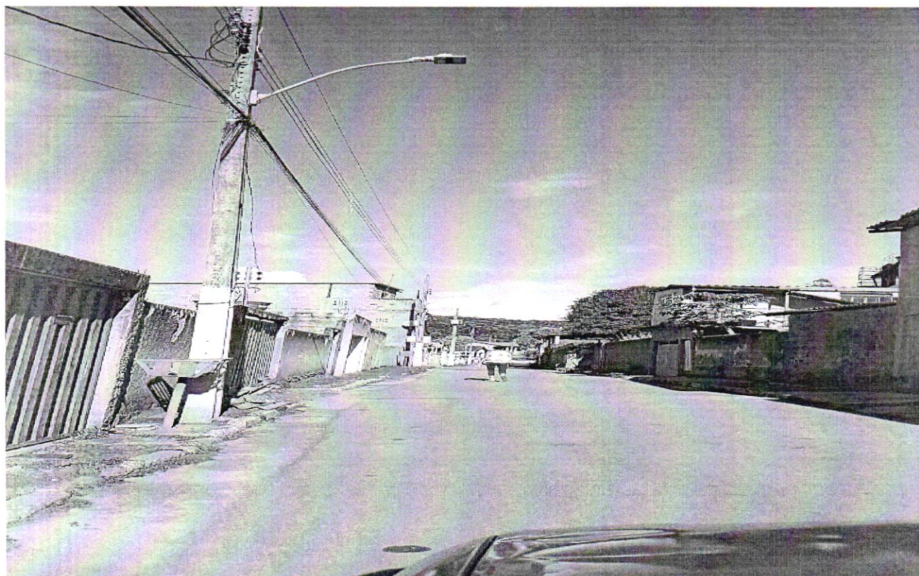
Quebra-Molas na Rua Santa Cecília