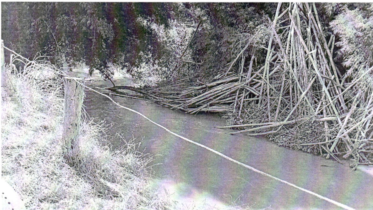
Limpeza do Rio