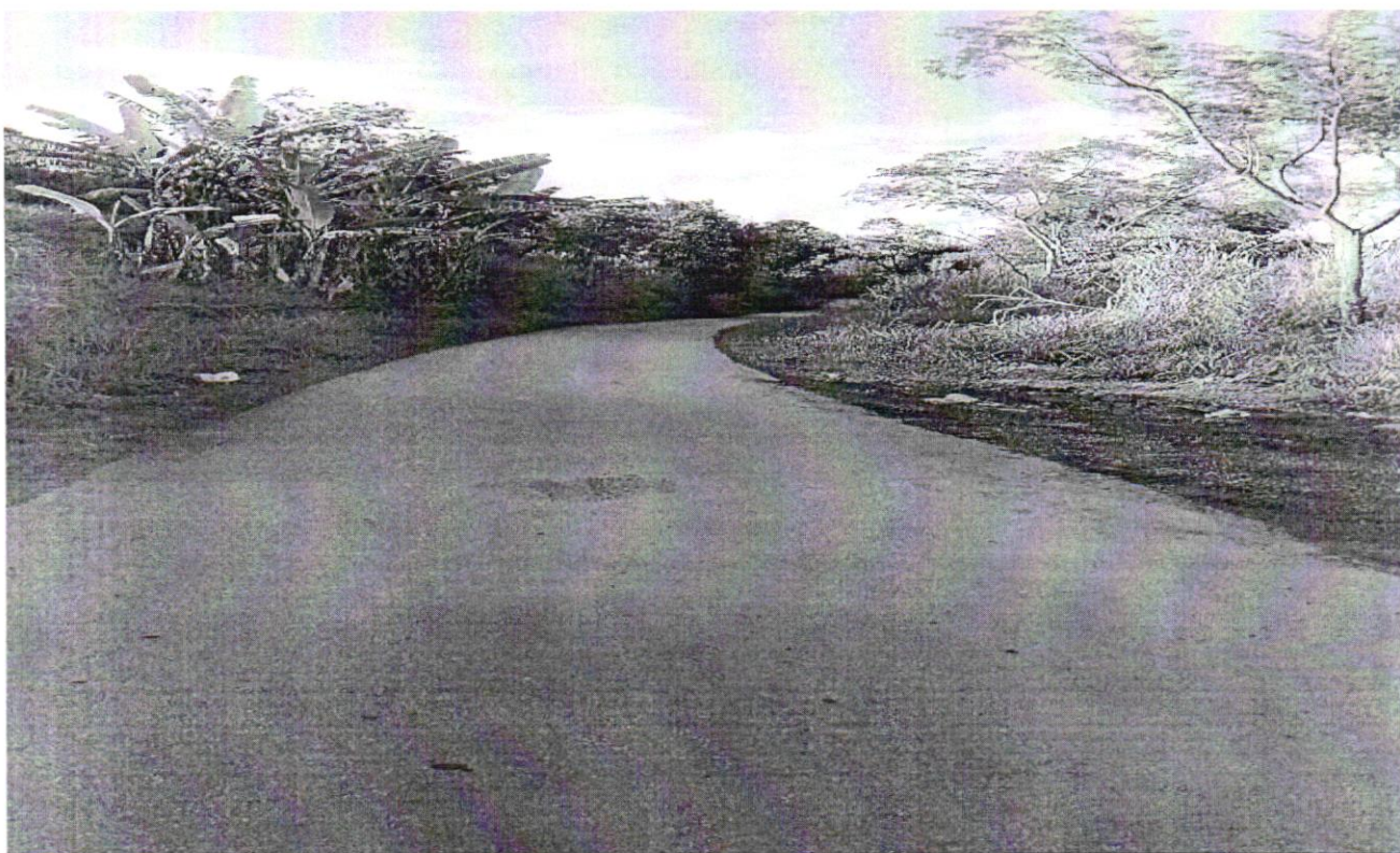
Rede Pluvial, Construção de Passeio e Meio-fio