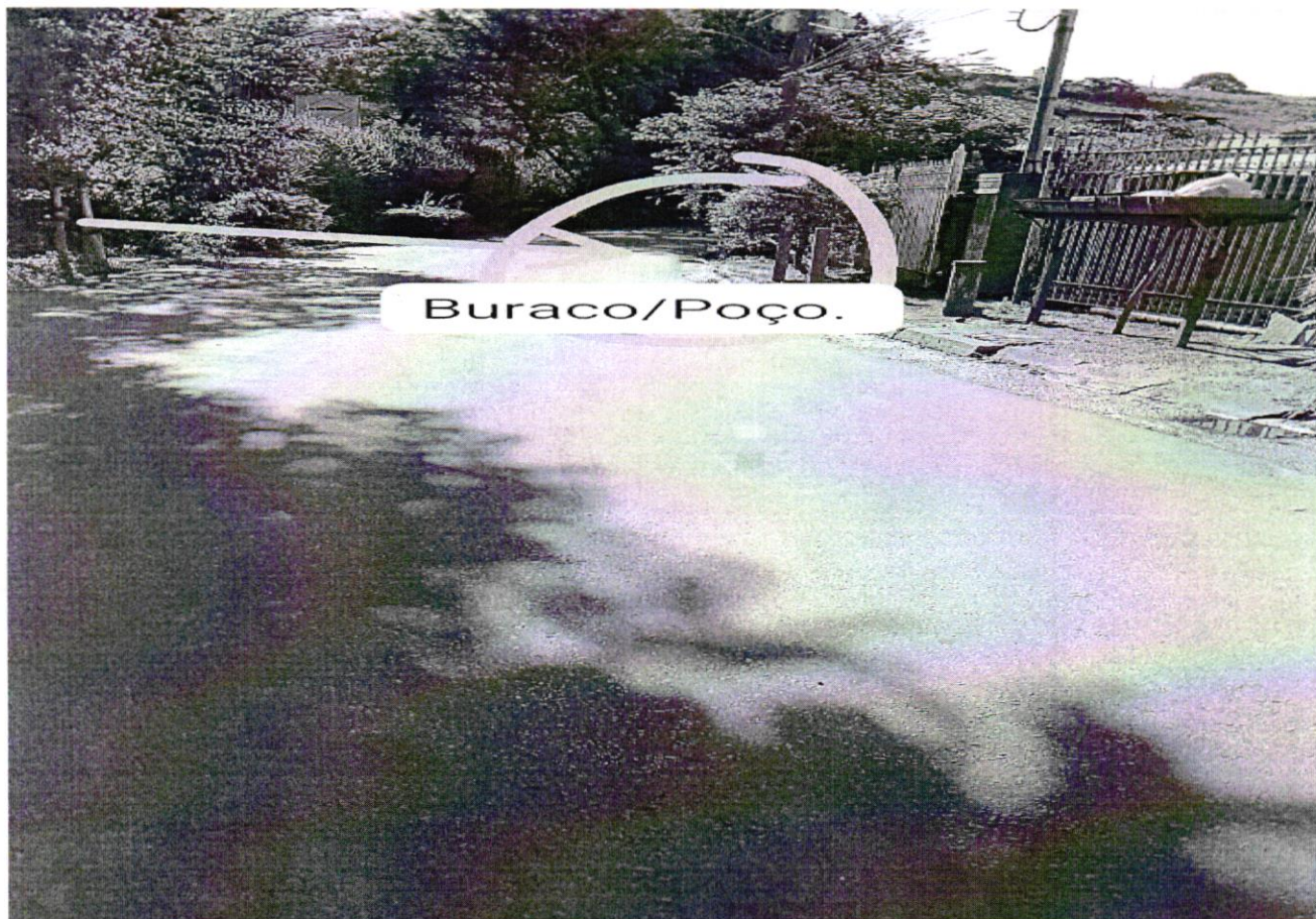
Solucionar problema do bueiro em frente a Igreja Assembleia de Deus.