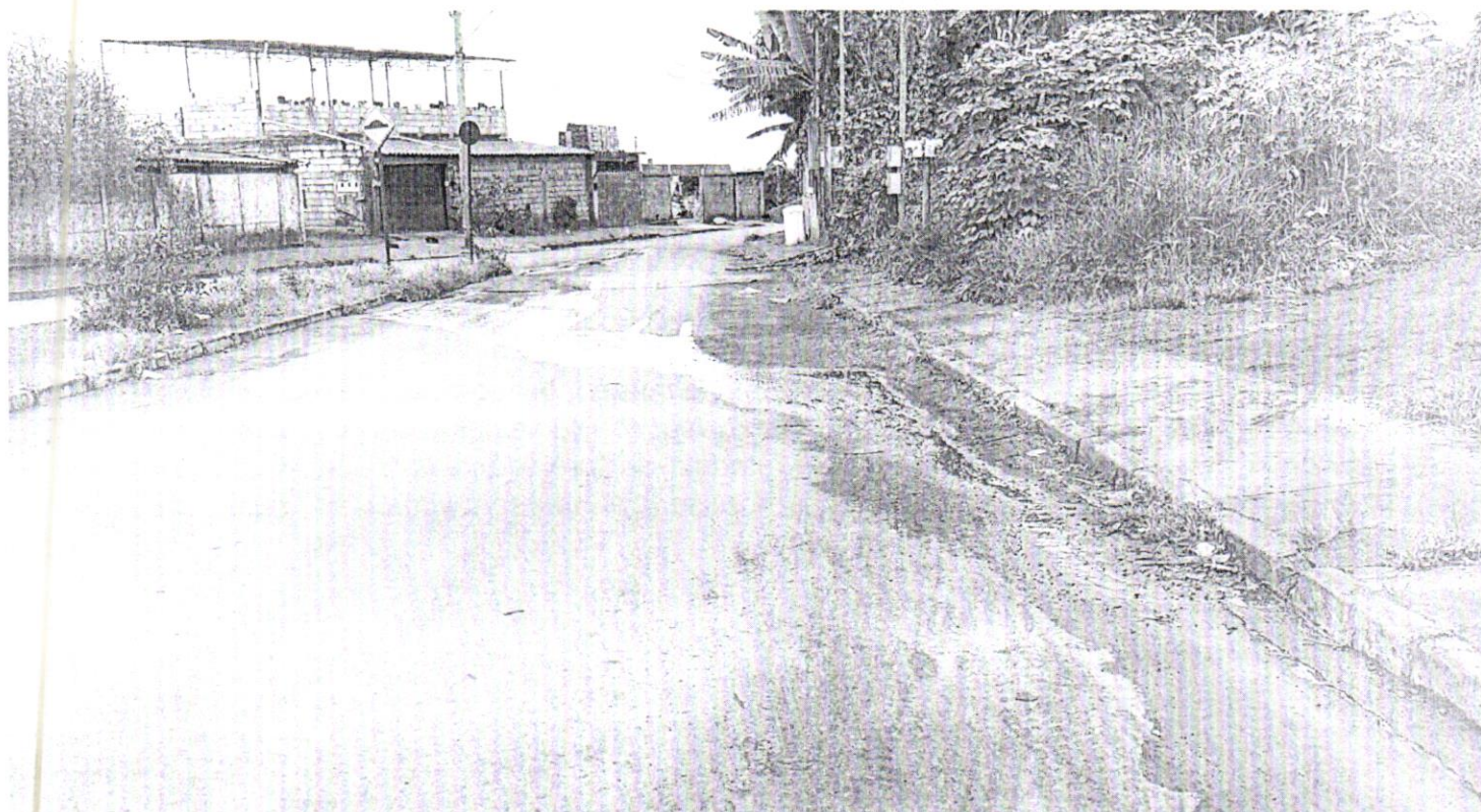
Praça Santo Antônio (Rede pluvial)

Casa do Legislativo Vereador Ênio da Gama