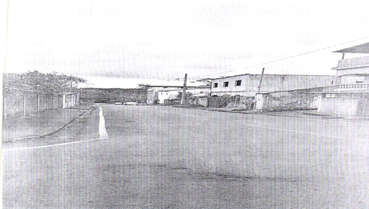
Rua Maria Delfina (Rede pluvial)