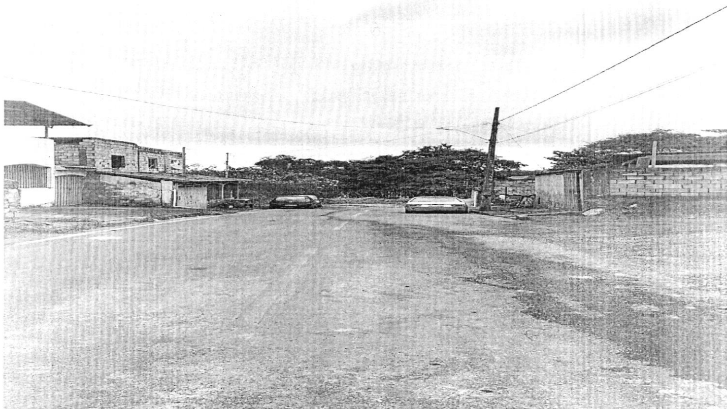
Rua Alfredina Martins (Rede pluvial)

Casa do Legislativo Vereador Ênio da Gama