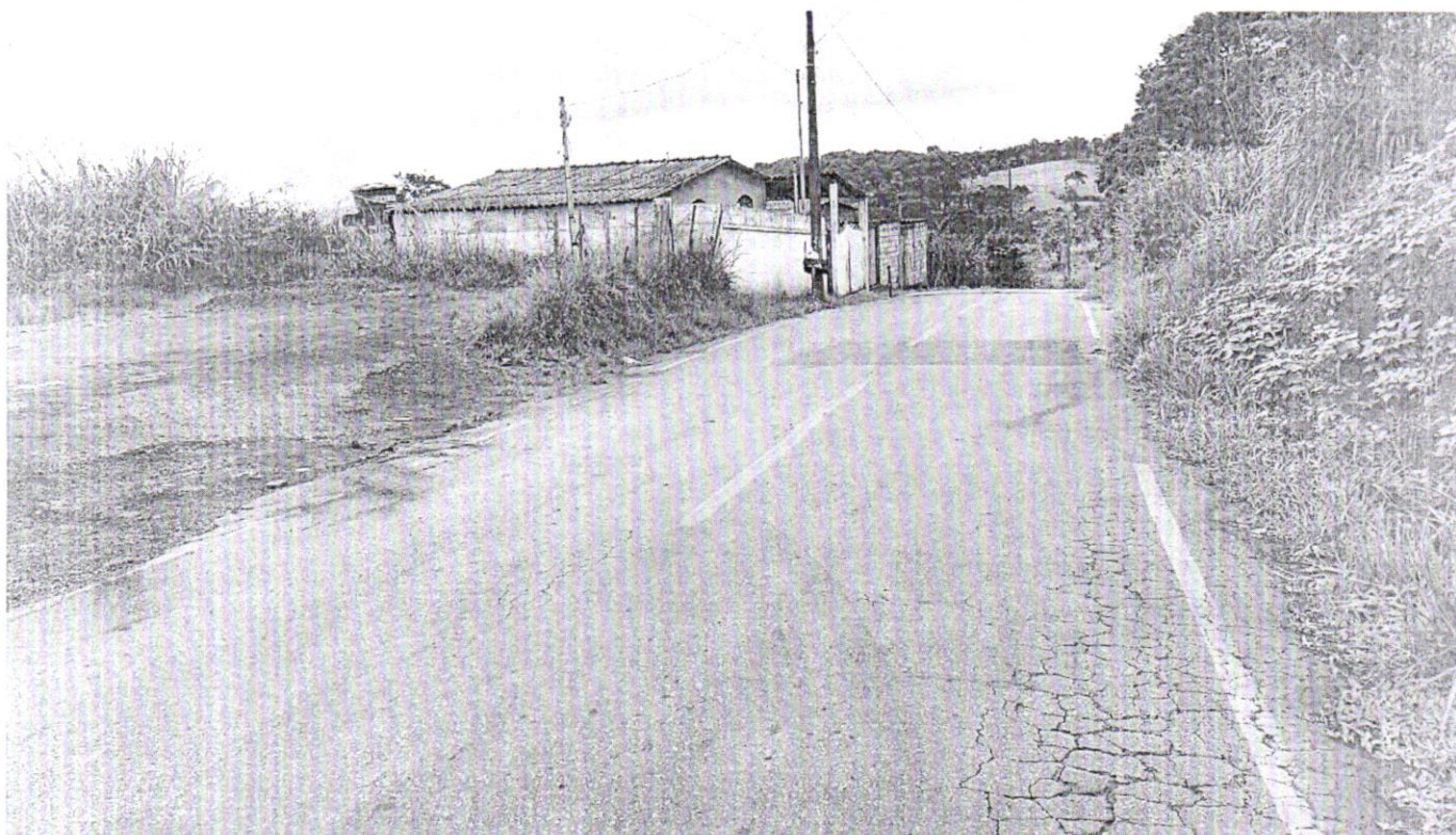
Rua José Cassimiro (rede pluvial)