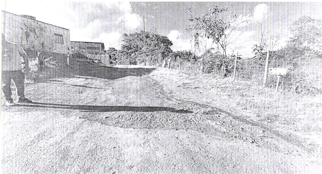
Rua Antônio Domingos de Paula (Pavimentação asfáltica, rede pluvial, extensão de rede elétrica, meio-fio)