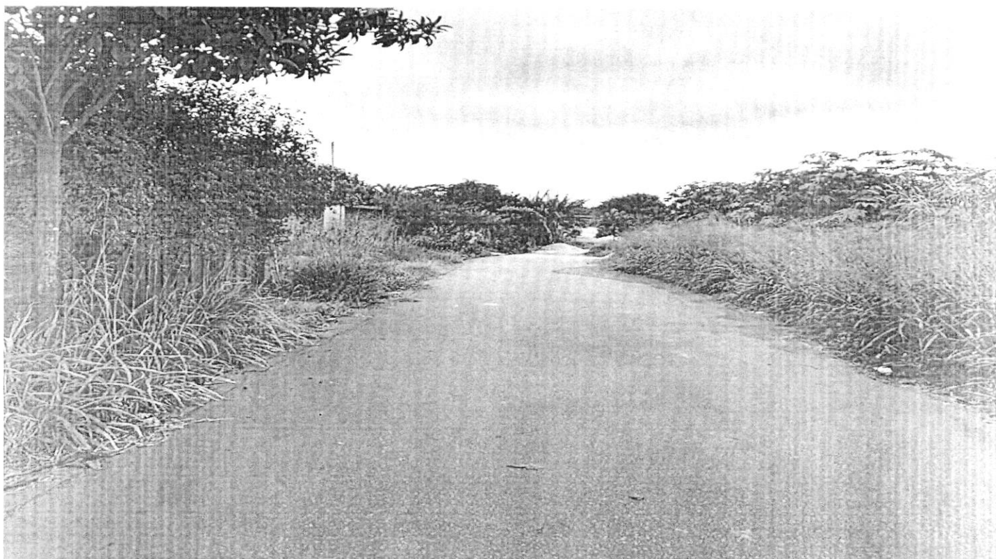
Rua Gerônimo Bonifácio (Extensão de rede elétrica, rede pluvial)