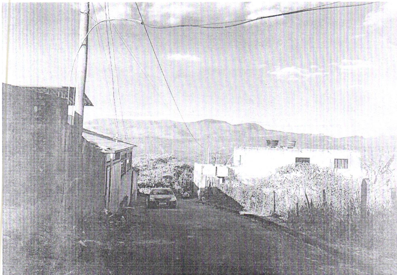
Rua José Jacinto Cândido (Extensão de rede elétrica, rede pluvial)