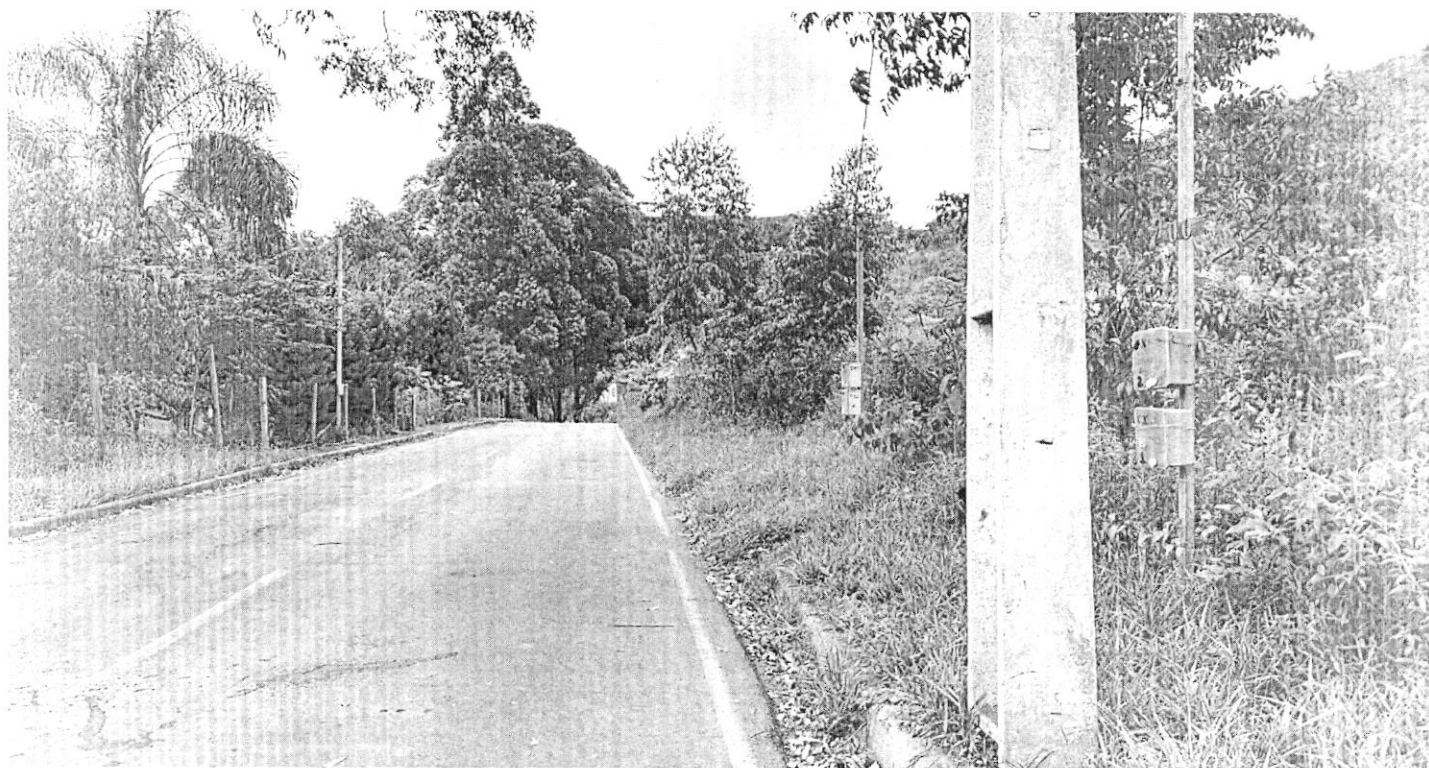
Rua Santo Antônio (Extensão de rede elétrica)