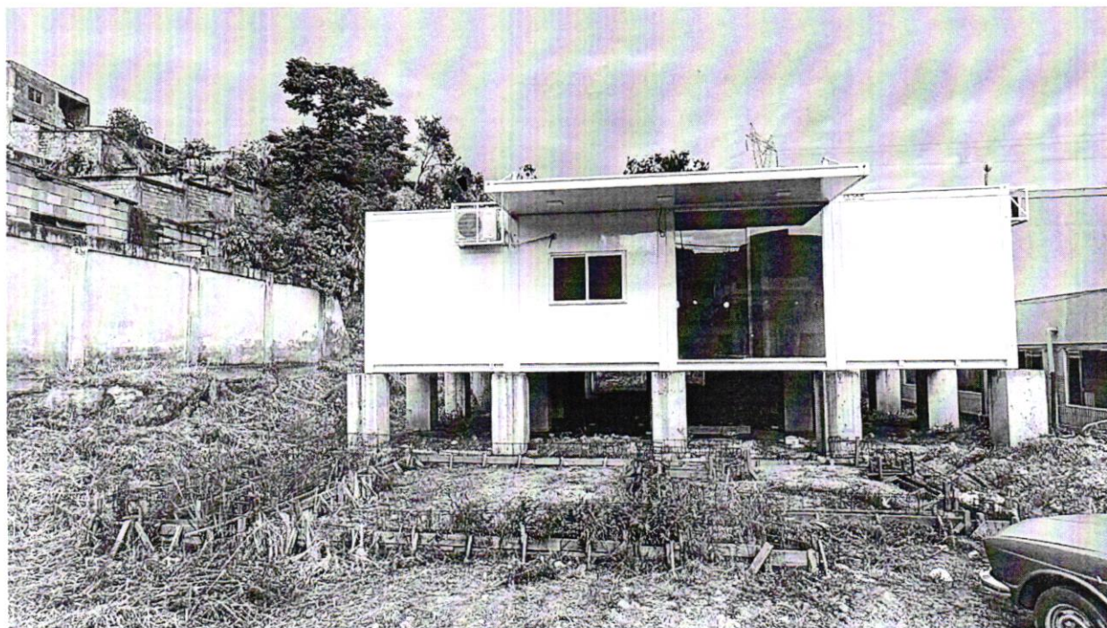
Rua Arlindo Moraes Faustino

Casa do Legislativo Vereador Ênio da Gama