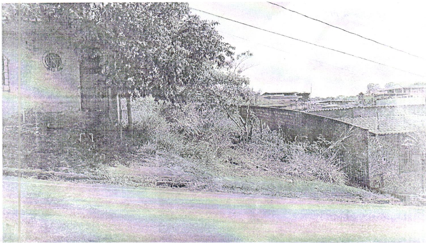
Rua Matheus Eduardo Gomes, proximidades do nº 118 – Leopoldino Barbosa

Casa do Legislativo Vereador Ênio da Gama