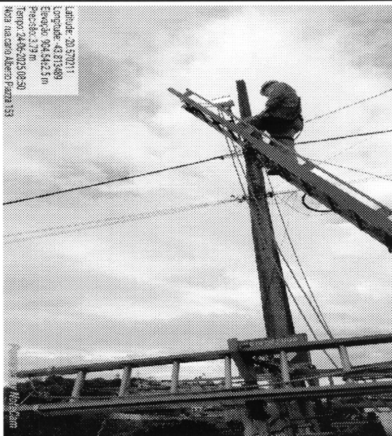
Manutenção de IP - Rua Carlos Alberto Piazza, em frente ao nº 153, bairro São Luiz.