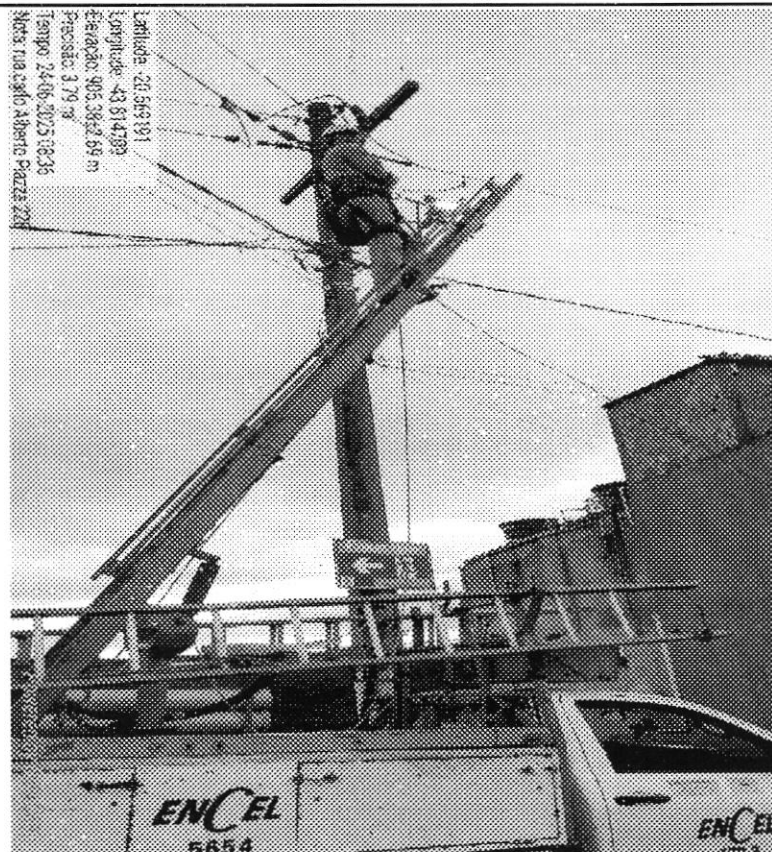
Manutenção de IP - Rua Carlos Alberto Piazza, em frente ao nº 228, bairro São Luiz.