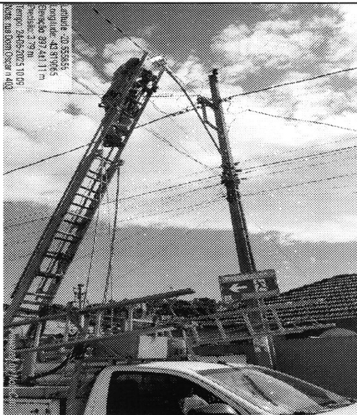
Manutenção de IP - Rua Dom Oscar de Oliveira, em frente ao 404, bairro Joaquim Murtinho.