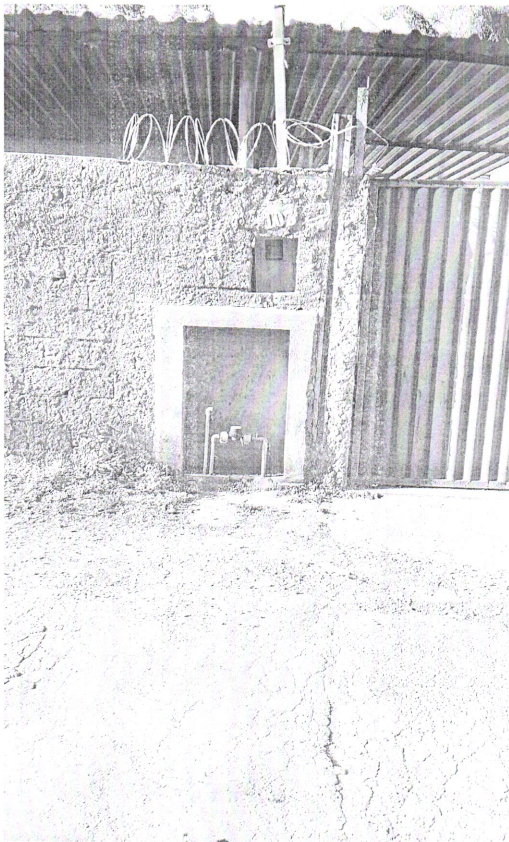
Casa do Legislativo Vereador Ênio da Gama