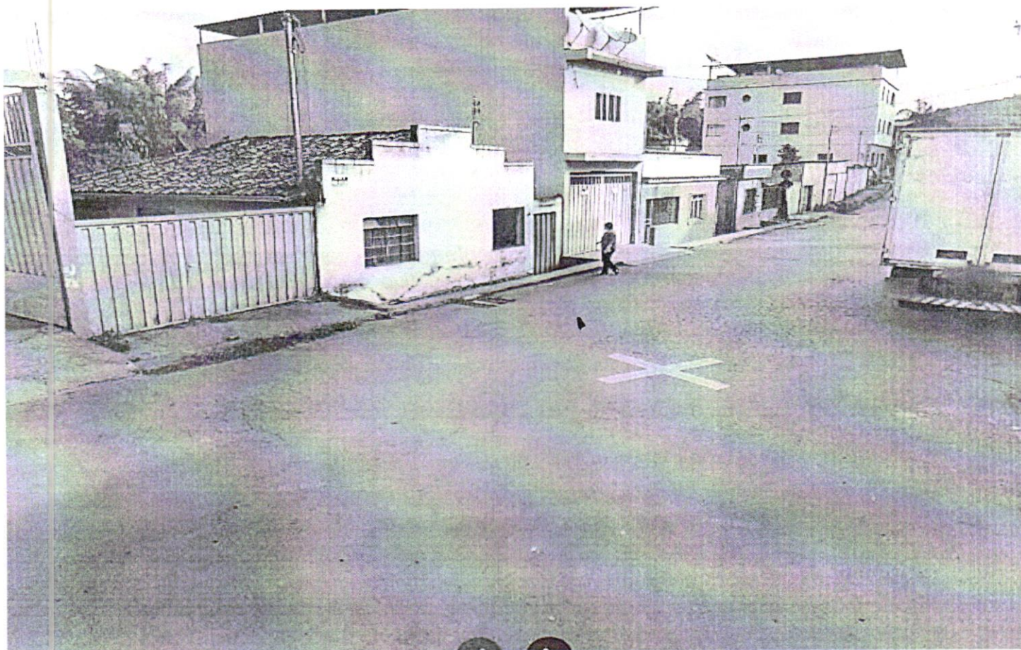
Rua Virgínia Josefina Guerra