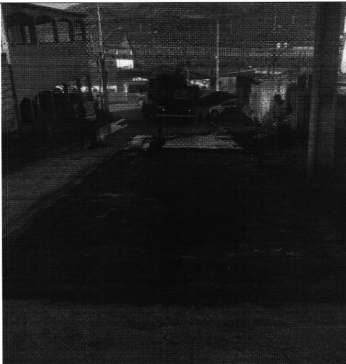
Rua Alfredo Pascoal