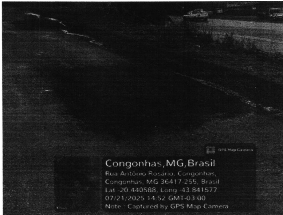
Rua Antônio Rosário