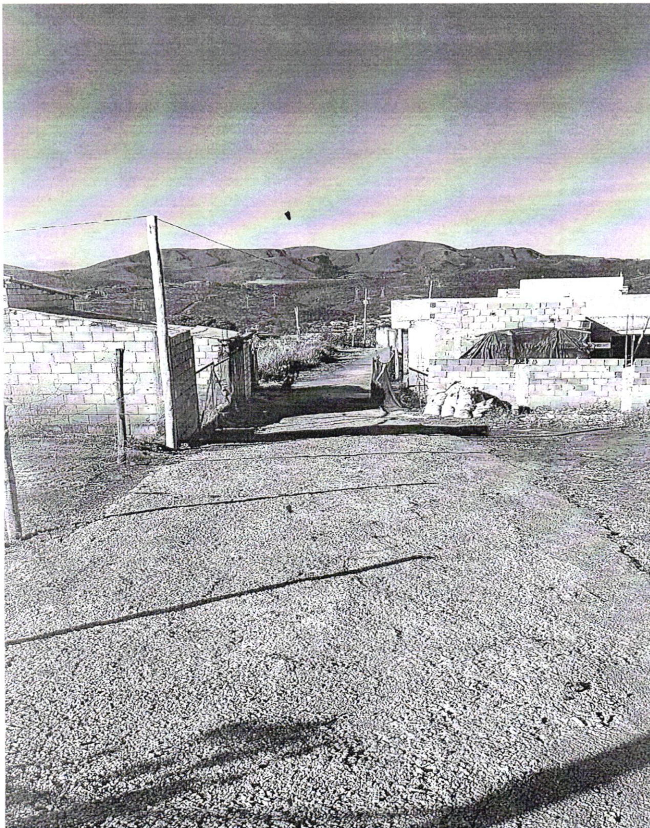
Travessa Cristóvão Dantas 2 (Pavimentação asfáltica; Drenagem de águas pluviais; Extensão de rede elétrica; Meios-fios).