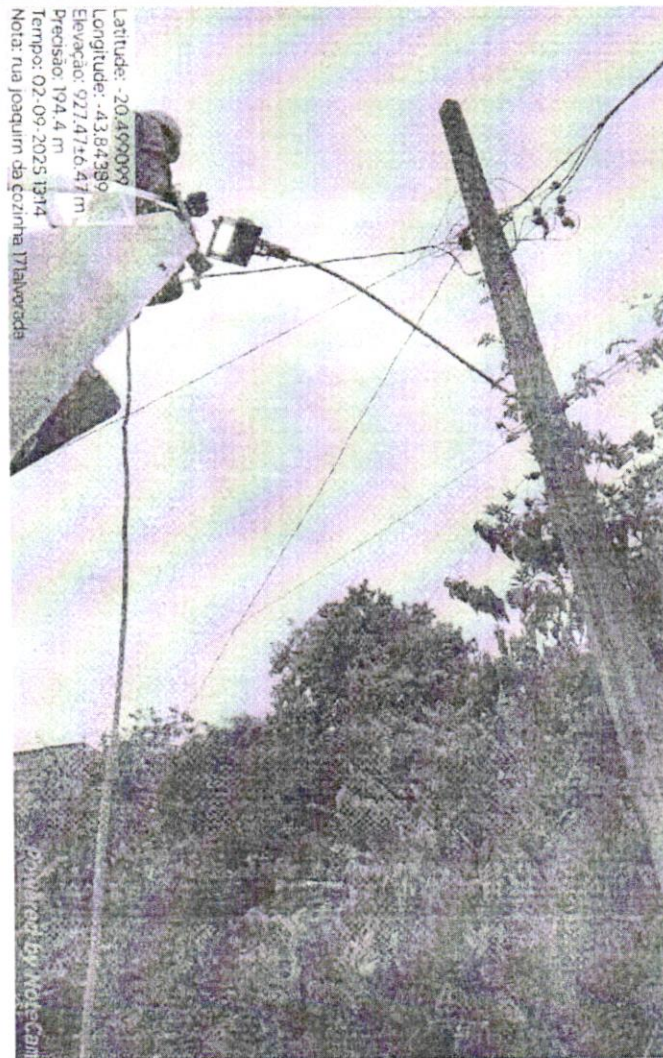
Manutenção de Iluminação Pública - Rua Joaquim da Rosinha, nº 171, Alvorada