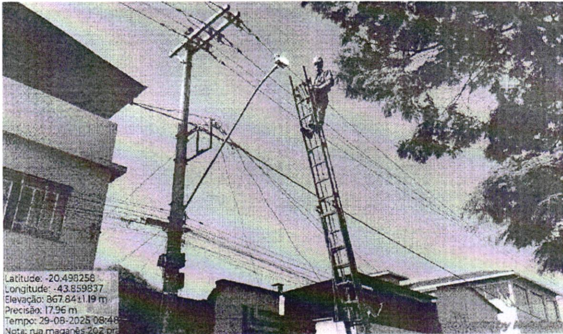
Manutenção de Iluminação Pública - Rua Manganês 202.