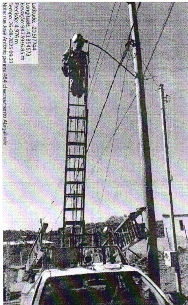
Manutenção de Iluminação Pública - rua José Antônio Pereira, nº 484, chacreamento Abigail.