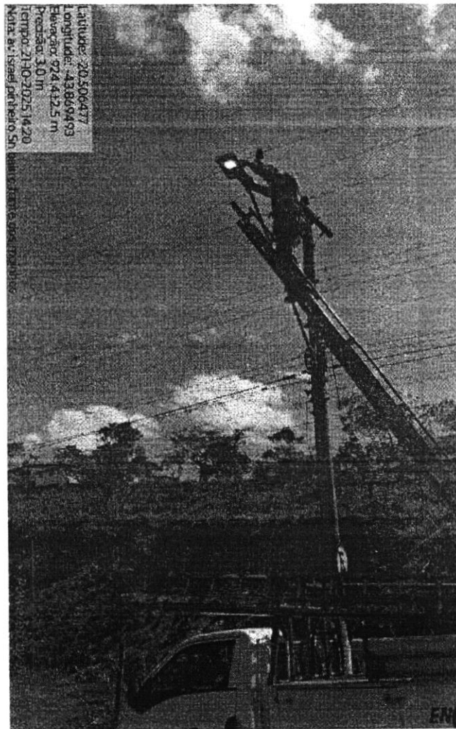
Manutenção de Iluminação Pública - rua Israel Pinheiro, bairro Fonte dos Moinhos.