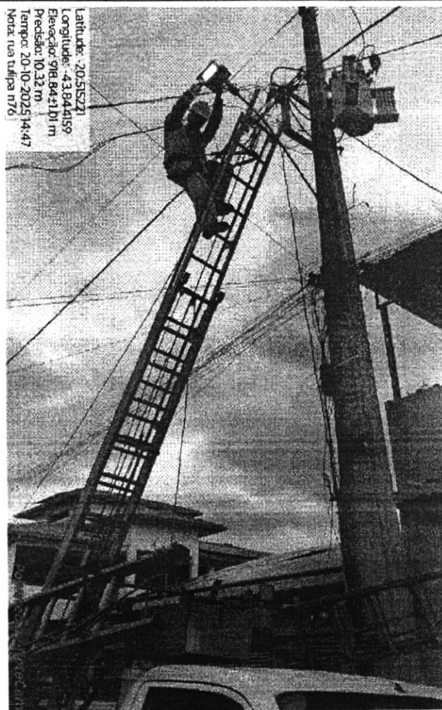
Manutenção de Iluminação Pública - rua Tulipa, em frente ao nº 76, bairro Belvedere.