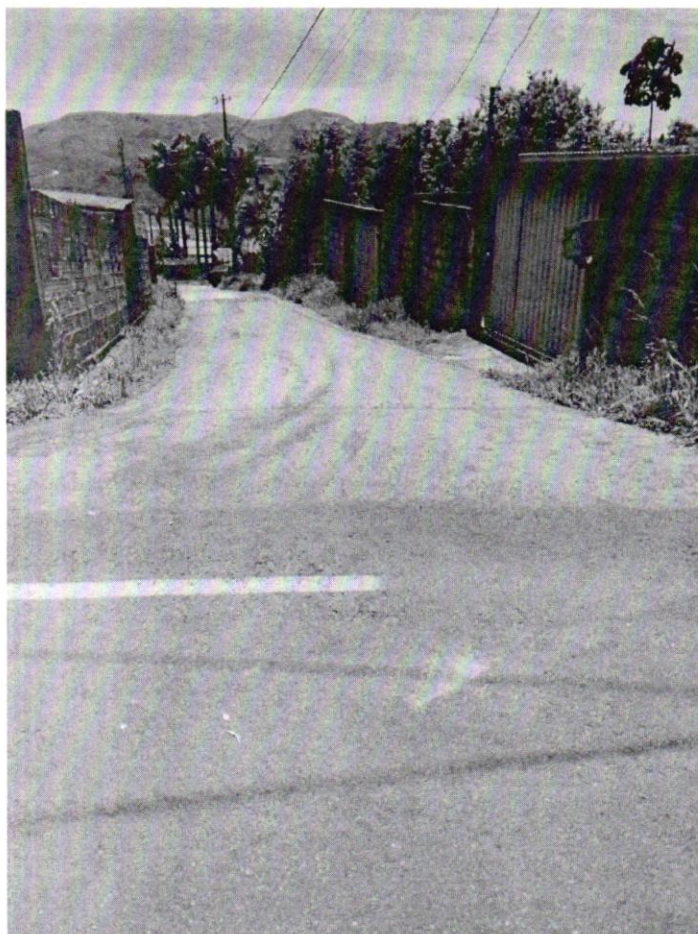
Fotos: Rua José Gregório de Moraes

Casa do Legislativo Vereador Ênio da Gama