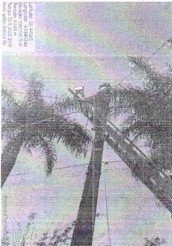
Manutenção de Iluminação Pública - rua Aprigio Batista, 116, Pires