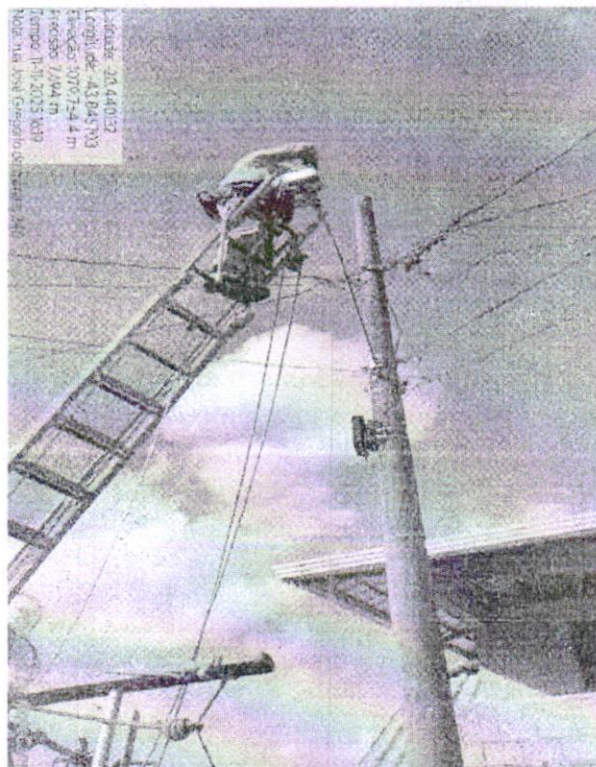
Manutenção de Iluminação Pública - rua José Gregório, 246, Pires