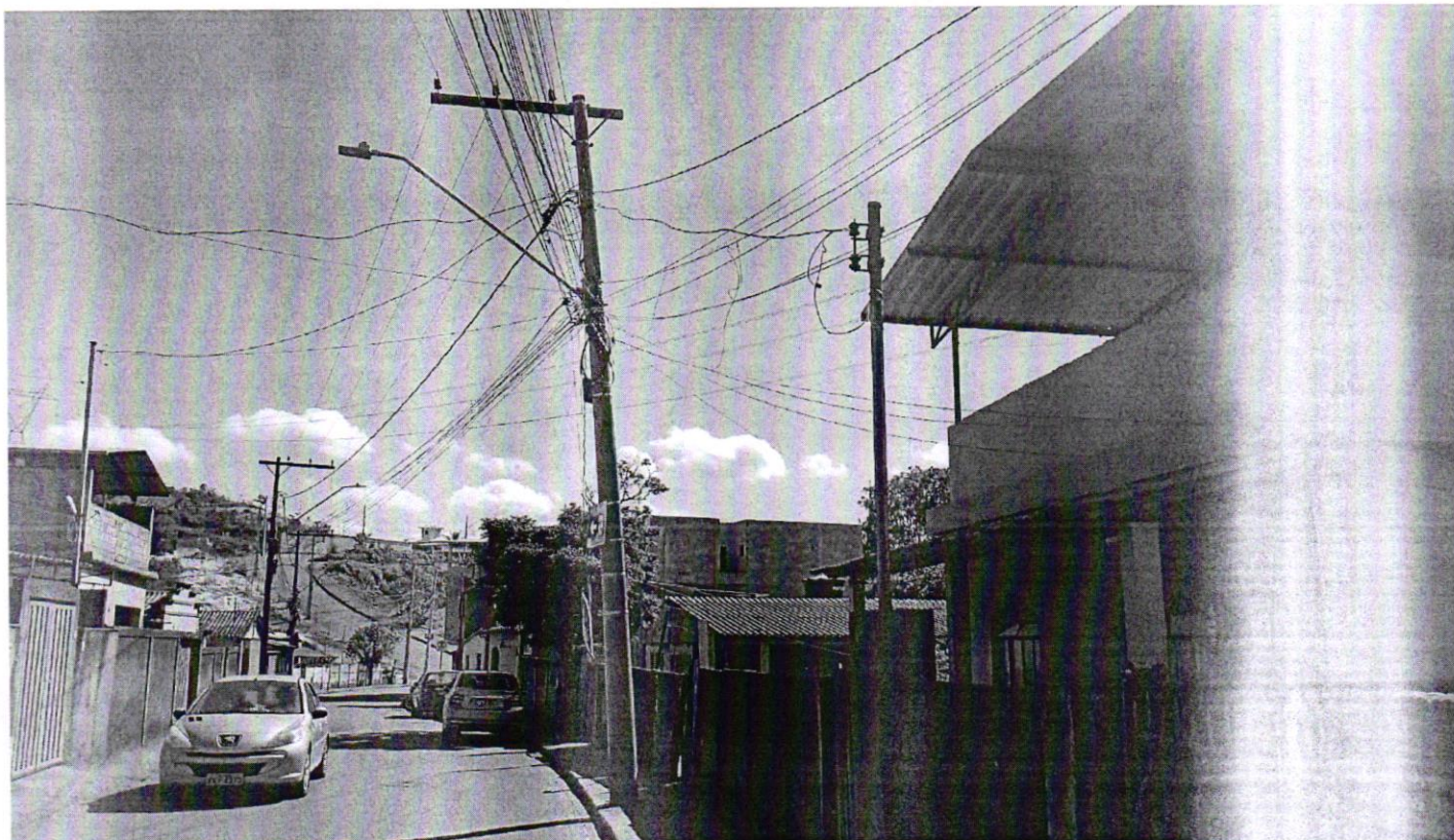
5. Substituição do poste de energia localizado na Rua José Moreira, em frente ao nº 452.