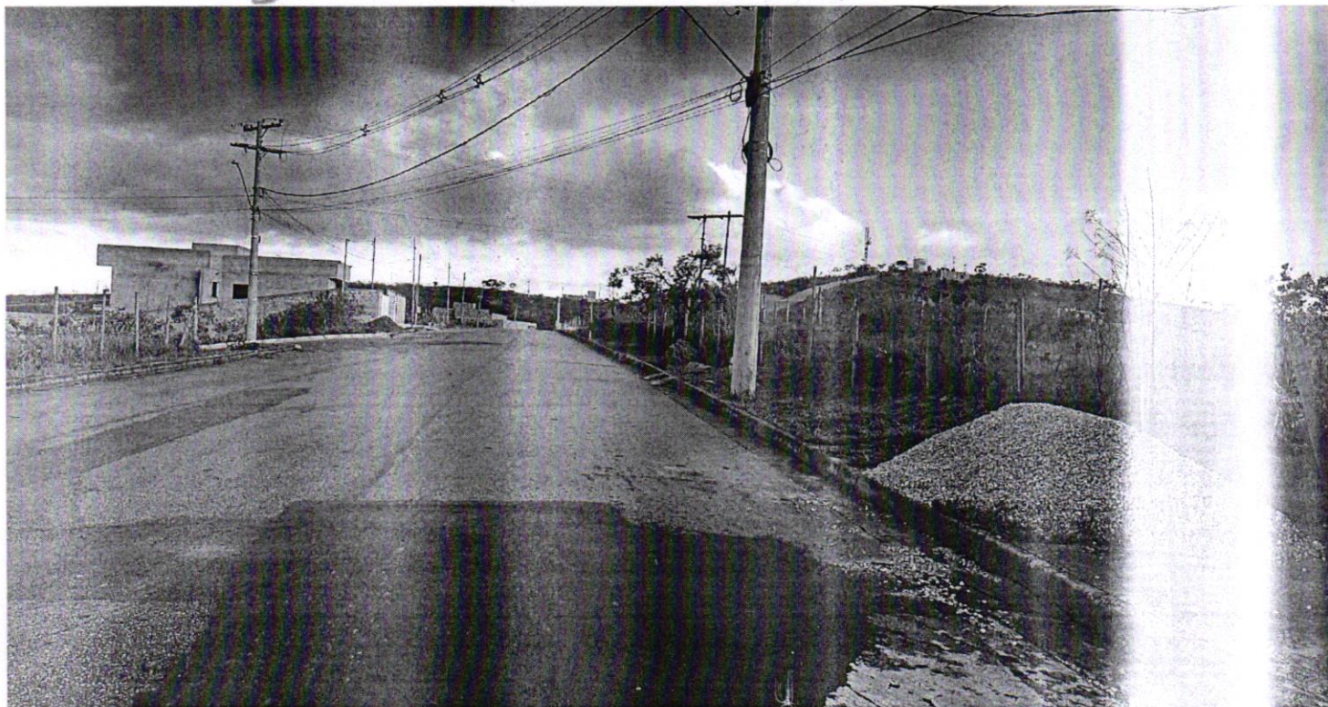
9. Instalação de abrigo de ônibus na Av. Rosa Assunção Cardoso Ferreira, próximo ao nº 66 Bairro Santa Vitória.