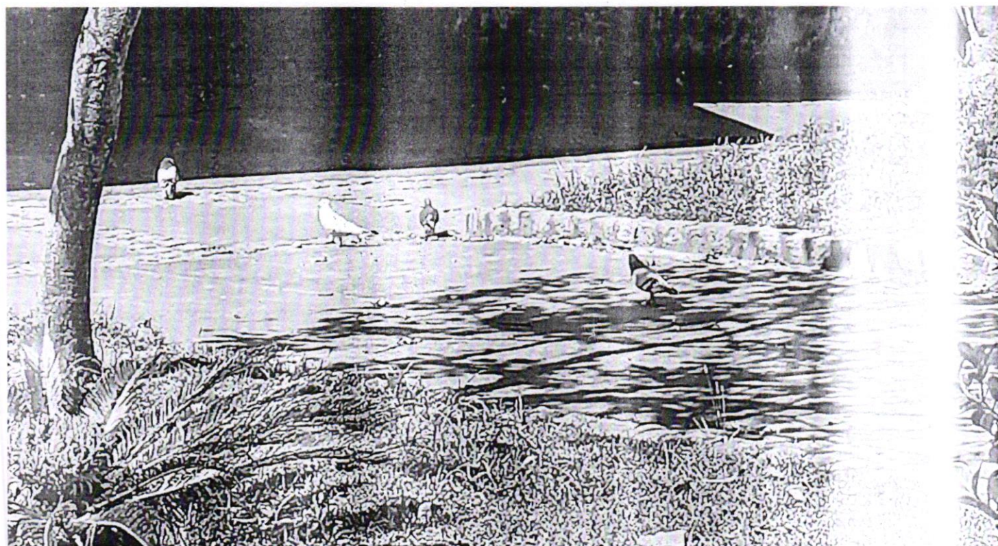
12. Adoção de providências quanto à infestação de pombos na Escola Dom João Muniz