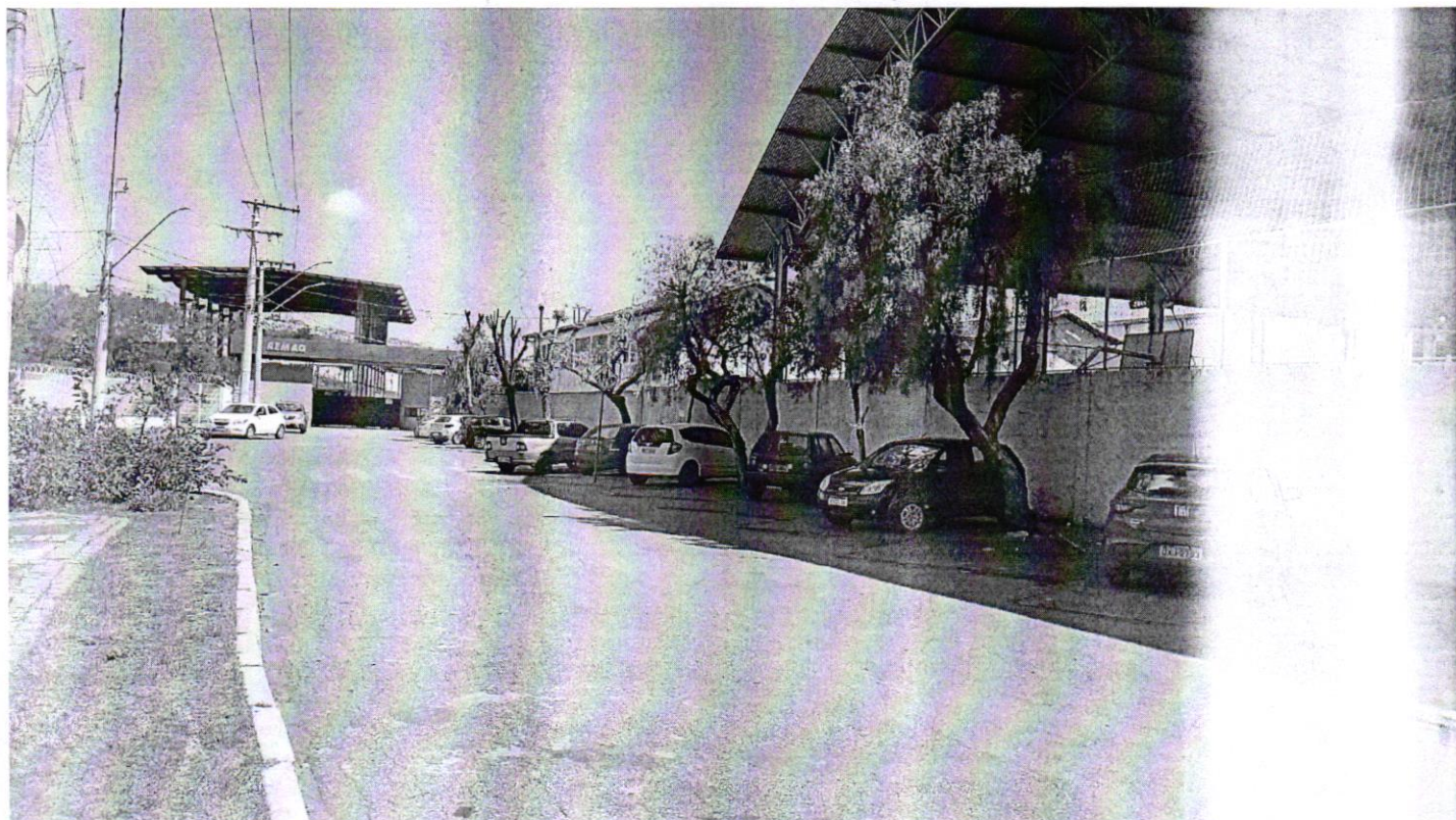
13. Drenagem das águas pluviais em frente à Escola Dom João Muniz.