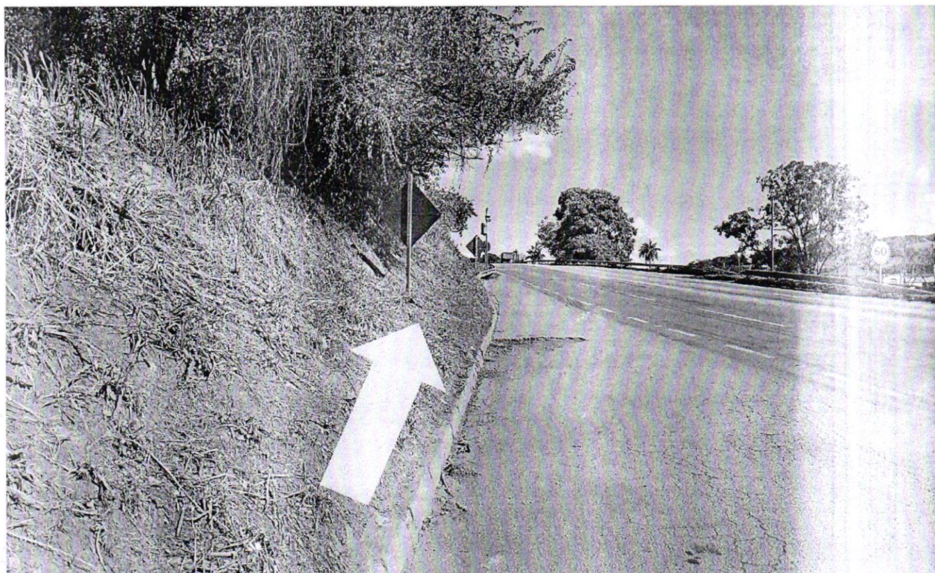
2. Criação de caminho seguro entre o bairro Jardim Profeta e o bairro Vila Condé.