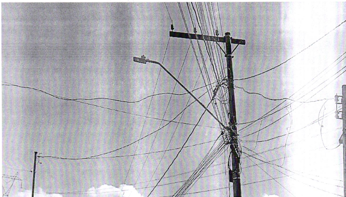
6. Retirada de cabos inutilizados nas vias públicas de todo o bairro Jardim Profeta.