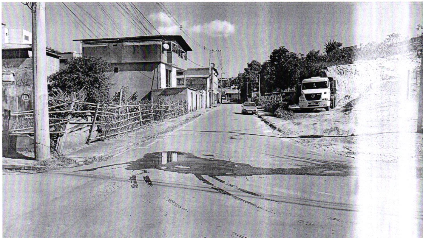
7. Análise técnica e instalação de quebra-molas na Rua Arlindo Moraes Faustino.