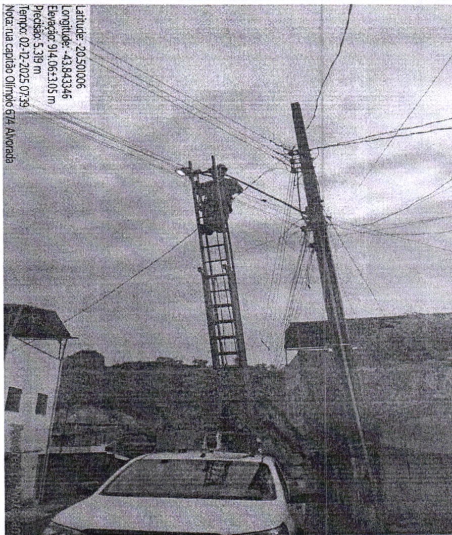
Manutenção de Iluminação Pública - Rua Capitão Olímpio, em frente ao nº 674, bairro Alvorada.