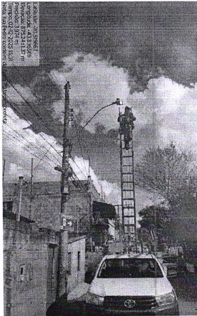
Manutenção de Iluminação Pública - rua Prudente de Cardoso, altura do nº 128, bairro Jardim Profeta