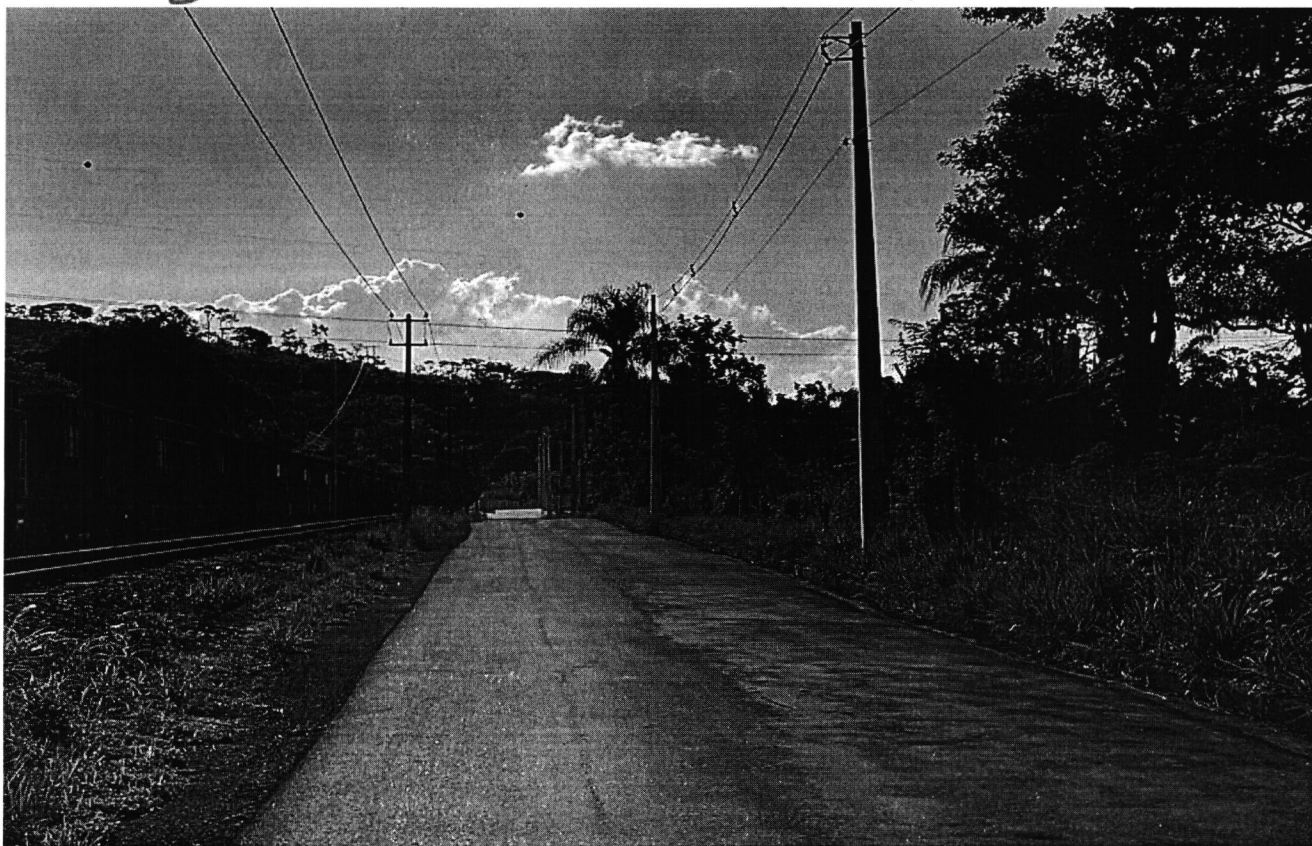
Instalação de meios-fios

Casa do Legislativo Vereador Ênio da Gama