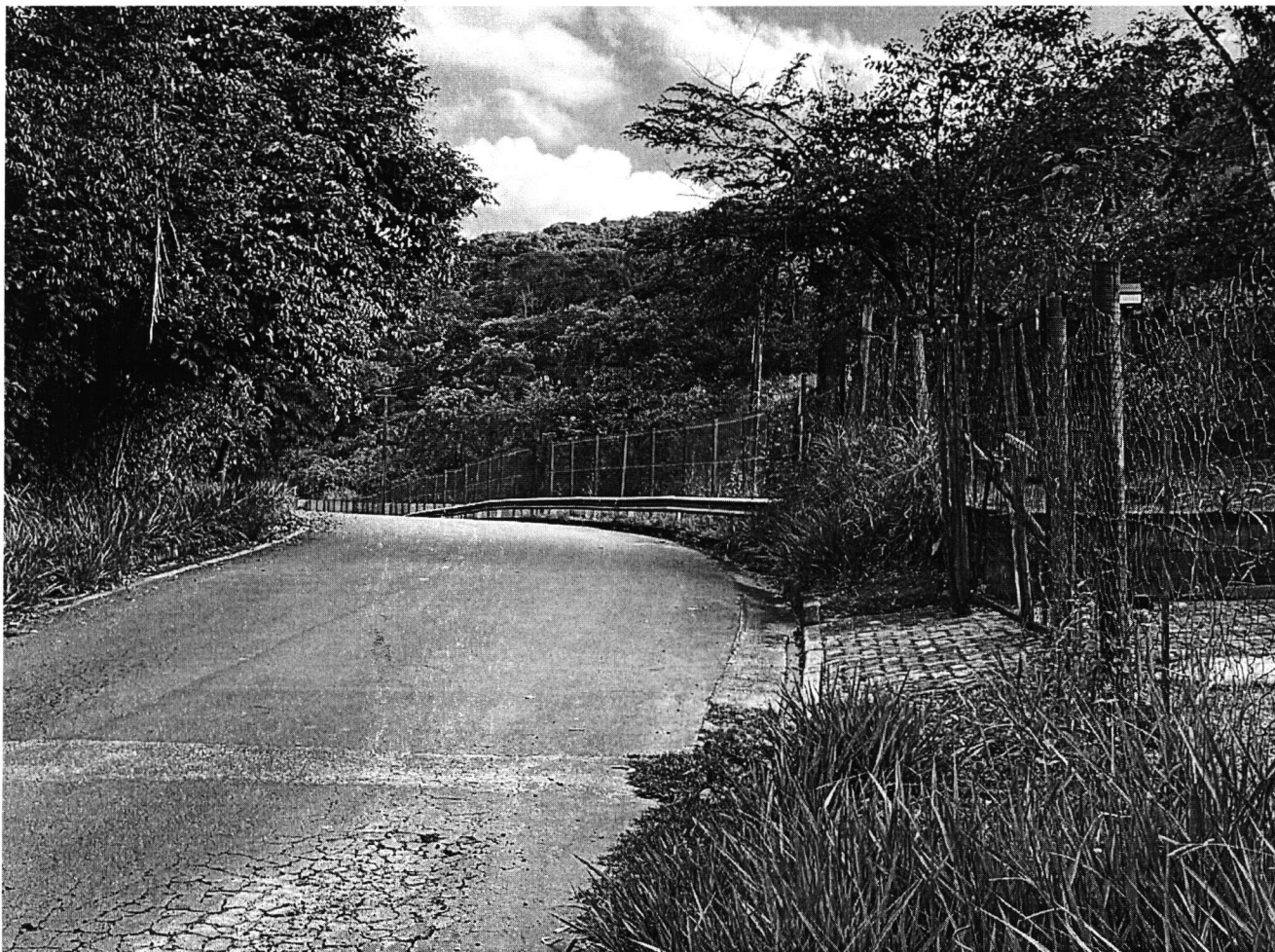
Extensão de rede elétrica, 616 (01 poste)

Casa do Legislativo Vereador Ênio da Gama