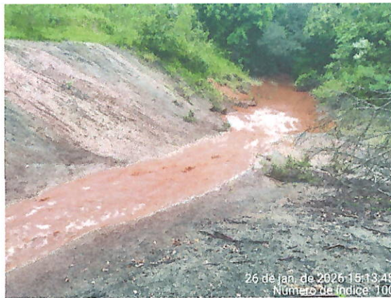
Foto 5 e 6 – Vista do efluente da área interna da empresa, após caixa de passagem, com coloração escura, direcionado para o curso d'água afluente do Rio Maranhão.