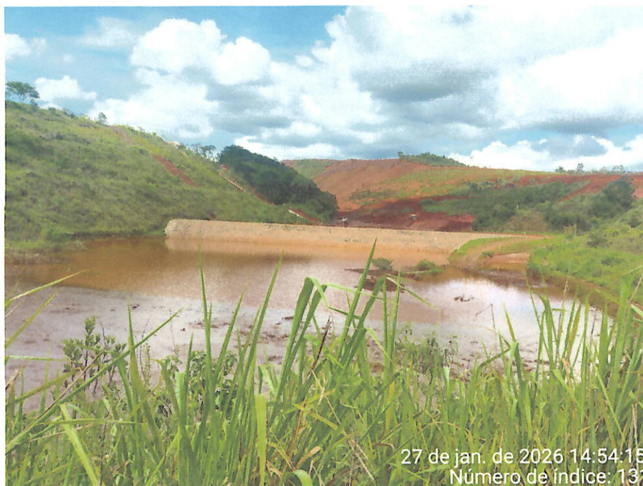
Foto 14 – Vista do acúmulo de água com sedimentos em área abaixo do Dique 2 do Fraile, paralela à ferrovia, além da presença de maquinário operando na área.