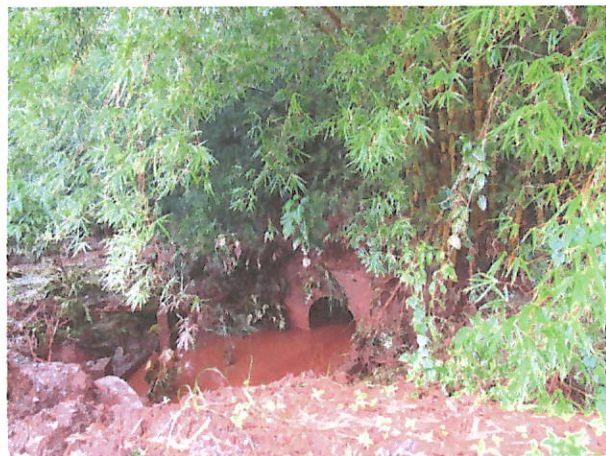
Foto 01 e 02 – Vista do efluente/curso d'água, com forte coloração na saída da manilha abaixo da ferrovia (ponto 1).