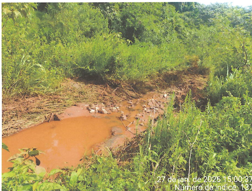
Foto 21 – Vista da coloração do curso d'água e do acúmulo de lama/sedimentos às margens do afluente do Rio Maranhão.