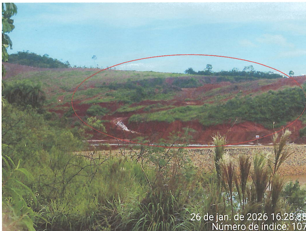
Foto 9 – Vista do acúmulo de água com sedimentos em área abaixo do Dique 2 do Fraile, paralela à ferrovia. Destaque para área com solo desnudo.