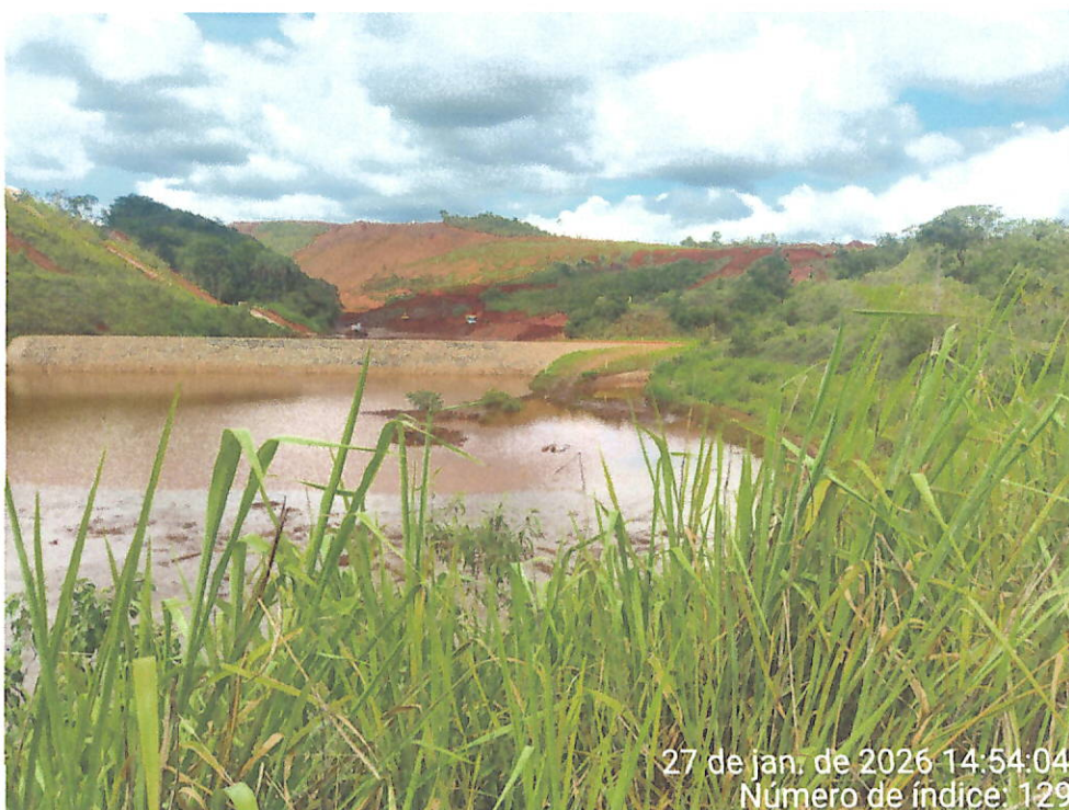
Foto 16 – Vista do acúmulo de água com sedimentos em área abaixo do Dique 2 do Fraile, paralela à ferrovia, além da presença de maquinário operando na área.