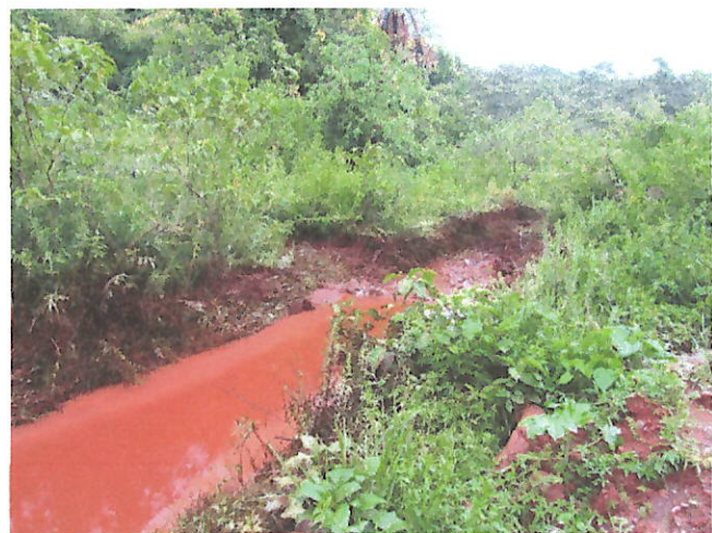
Foto 03 e 04 – Vista do curso d'água, com coloração escura (ponto 1)