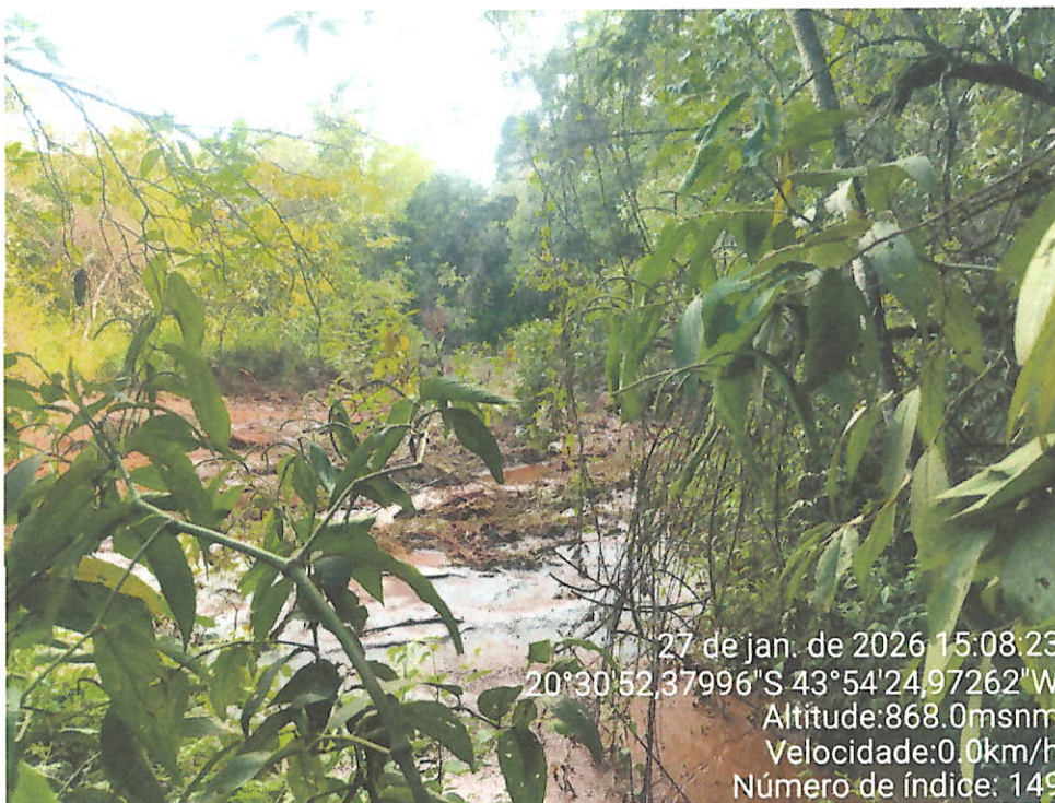
Foto 19 – Vista do acúmulo de lama/sedimentos às margens do afluente do Rio Maranhão.