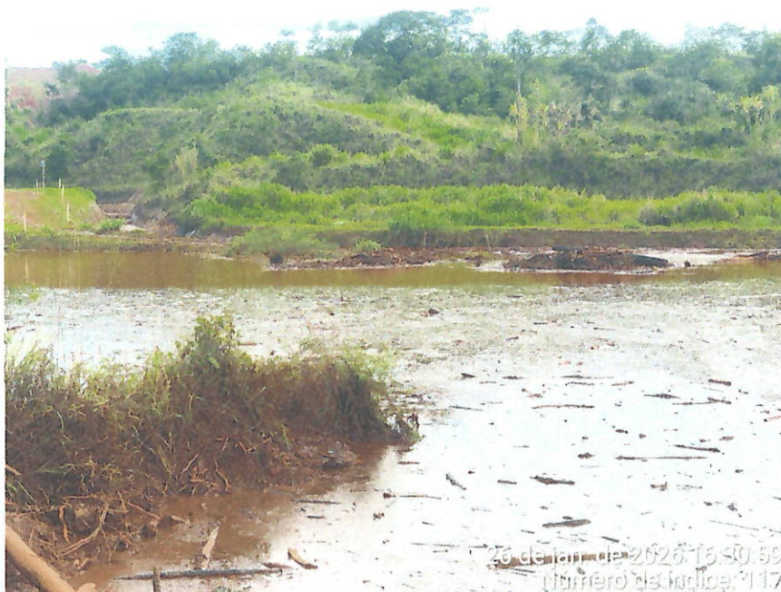
Foto 12 – Vista do acúmulo de água com sedimentos em área abaixo do Dique 2 do Fraile, paralela à ferrovia. Destaque para canaleta.