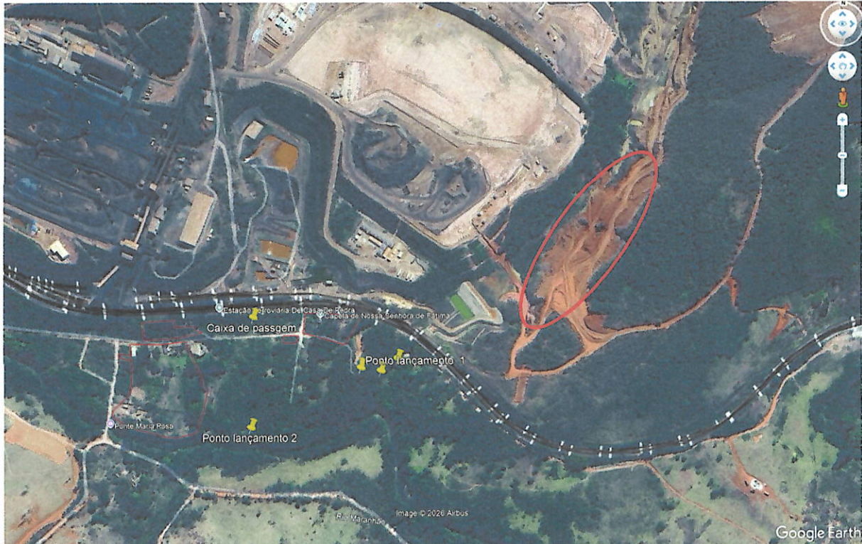
Imagem 01 – Fonte: Google Earth – data de acesso 30/01/2026.