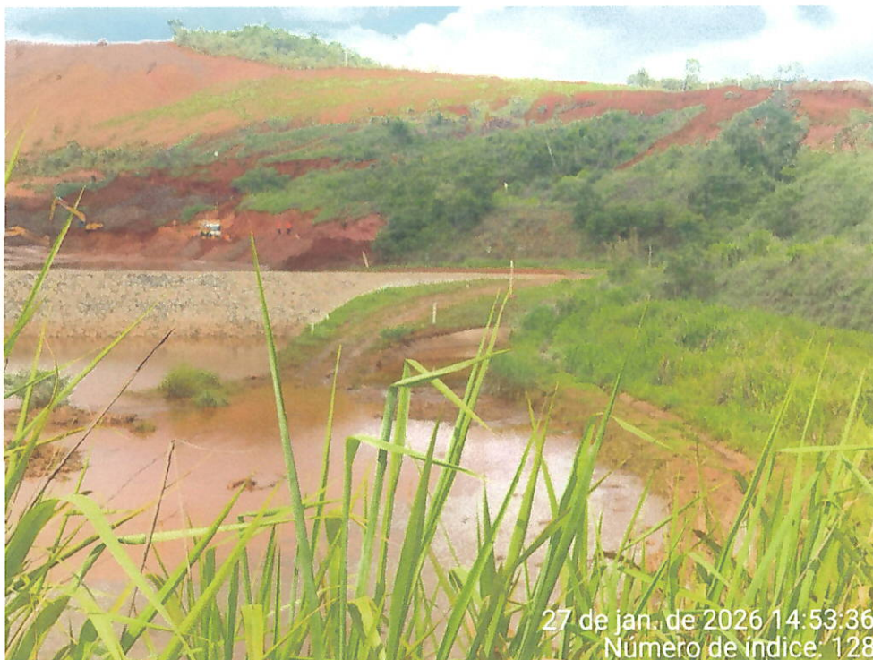
Foto 15 – Vista do acúmulo de água com sedimentos em área abaixo do Dique 2 do Fraile, paralela à ferrovia, além da presença de maquinário operando na área.