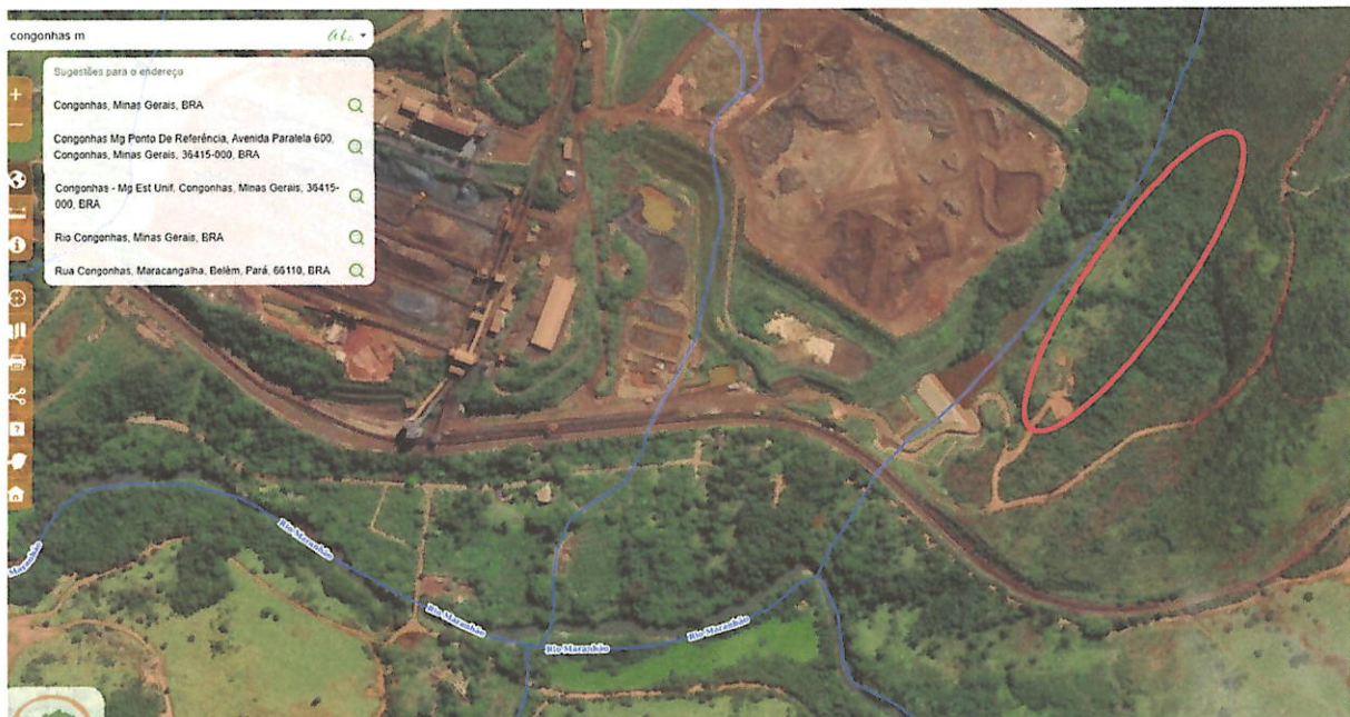
Imagem 02 – Fonte: IDE SISEMA – data de acesso 02/02/2026.