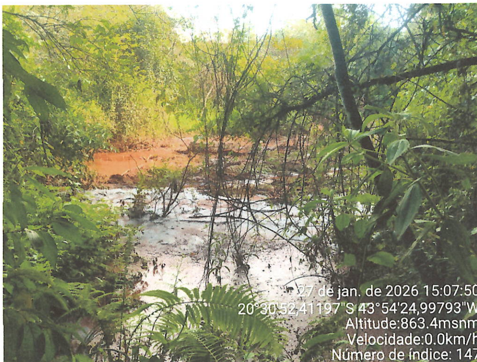
Foto 20 – Vista do acúmulo de lama/sedimentos às margens do afluente do Rio Maranhão.