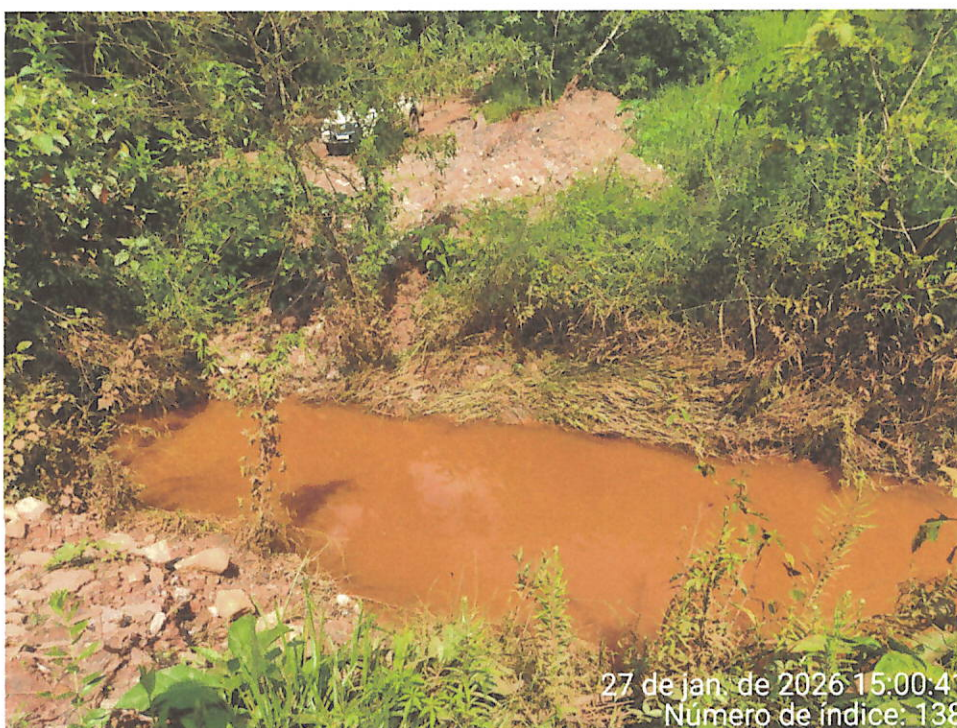
Foto 22 – Vista da coloração do curso d'água e do acúmulo de lama/sedimentos às margens do afluente do Rio Maranhão.