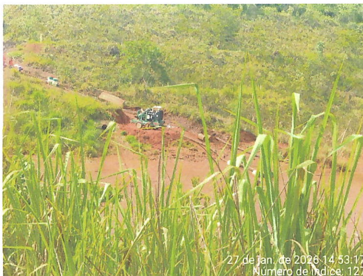
Foto 18 – Vista do acúmulo de água com sedimentos em área abaixo do Dique 2 do Fraile, paralela à ferrovia, além da presença de maquinário e bombeamento operando na área.