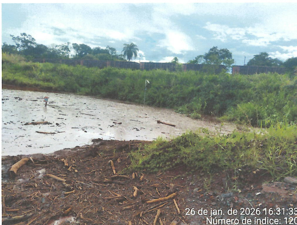
Foto 10 – Vista do acúmulo de água com sedimentos em área abaixo do Dique 2 do Fraile, paralela à ferrovia. Destaque para placa de sinalização quase completamente encoberta.