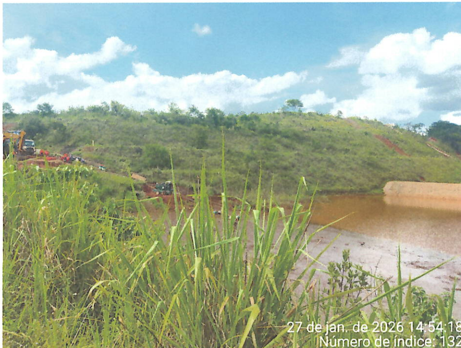
Foto 17 – Vista do acúmulo de água com sedimentos em área abaixo do Dique 2 do Fraile, paralela à ferrovia, além da presença de maquinário e bombeamento operando na área.