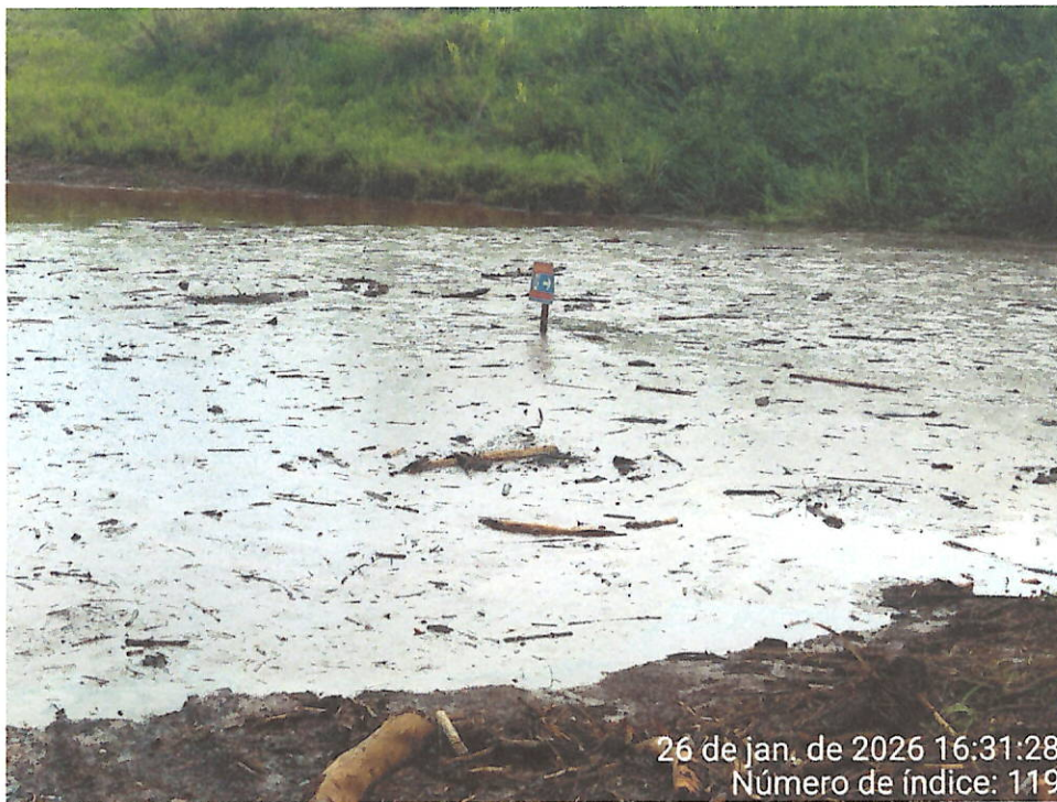
Foto 11 – Vista do acúmulo de água com sedimentos em área abaixo do Dique 2 do Fraile, paralela à ferrovia. Destaque para placa de sinalização quase completamente encoberta.