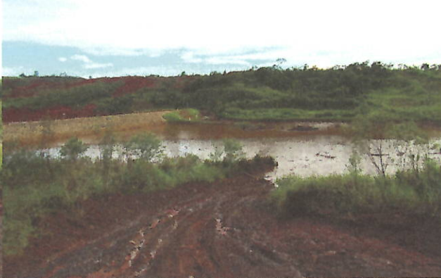
Foto 7 e 8 – Vista do acúmulo de água com sedimentos em área abaixo do Dique 2 do Fraile, paralela à ferrovia.

Handwritten signature: Bacharel Handwritten text: meilose